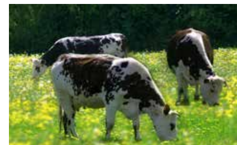
Vaches en pâture