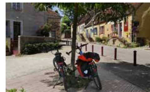
La Perrière