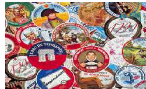
Étiquettes de boîtes de camembert