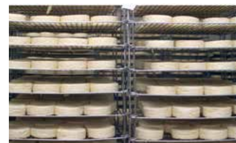
Fromagerie Gillot