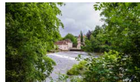
Abbaye Fontgombault