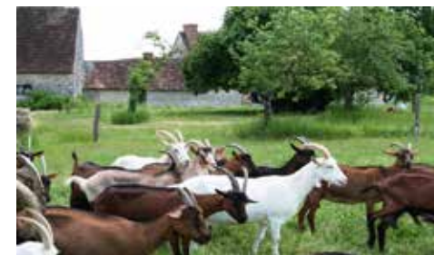
Chèvres Pouligny

Place Mado Robin 37290 Yzeurs/Creuse Horaires d'ouverture au public : le 31/07 18h-22h