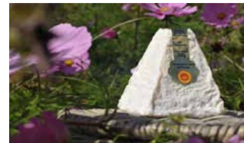
Pouligny Saint Pierre