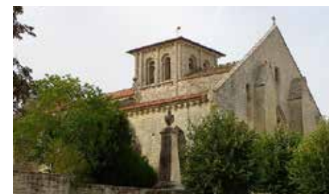
Eglise Saint-Maixent à Prahecq