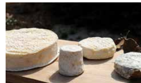
Fromage de Chèvre du Poitou