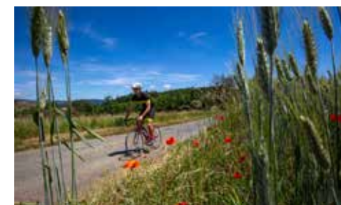
Cycliste sur route

Le Frigalet 69870 Grandris Fromages : Vache Horaires d'ouverture au public : sur RDV Distance : 4,3 km