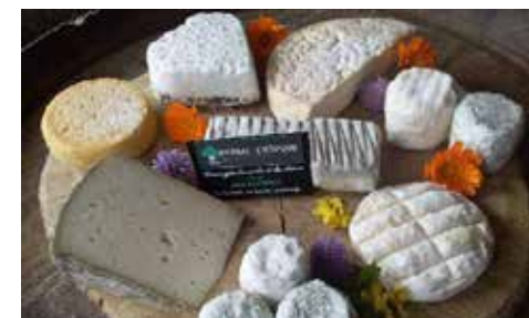
Plateau de fromages