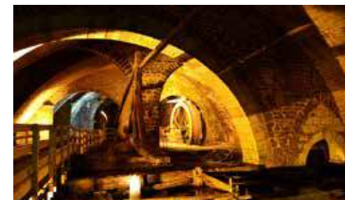
Caves d'affinage

2 chemin des vignes 39110 MARNOZ 03 84 73 03 16 Fromages : Chèvre Horaires d'ouverture au public - Visite : d'avril à octobre