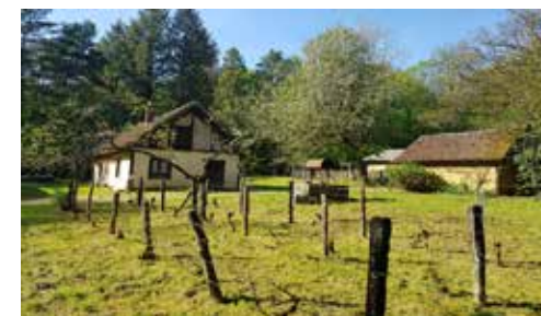
Fermes jurassiennes