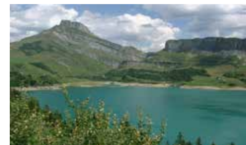
Paysages du Beaufortain

La Bâthie 04 79 89 52 30 Fromages : AOP Beaufort, IGP Raclette de Savoie, IGP Tomme de Savoie Distance : 6,2 km