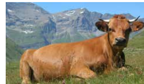
Vache Tarine