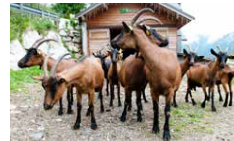
Chèvres de la ferme du Petit Mont