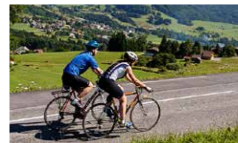
Cyclotourisme en Vallée Verte