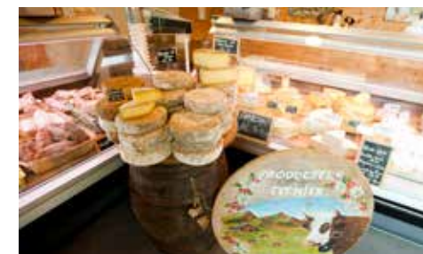
CAEC Le Plane