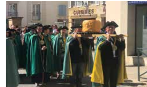
Chapitre de la confrérie des Tastes-Fromages de Langres

Grande Rue 52150 Illoud 03 25 30 81 00 accueil@ladivinefromagerie.fr Fromages : Caprice des Dieux Horaires d'ouverture au public : du mardi au vendredi (10h-12h30 et 14h-18h) et le samedi (10h-12h30 et 14h-18h30). Fermeture les jours fériés Distance : 1,15 km