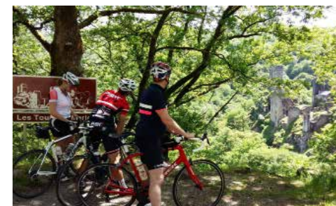
Cyclotourisme aux Tours de Merle

1, route des Pierres Blanches 19220 St Julien aux bois 05 55 28 41 94 Fromages : de la fromagerie Duroux Horaires d'ouverture au public : en juillet et août tous les jours. Hors saison, fermé le ven. sam et le dim. soir Distance : sur l'itinéraire