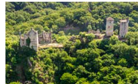
Tours de Merle