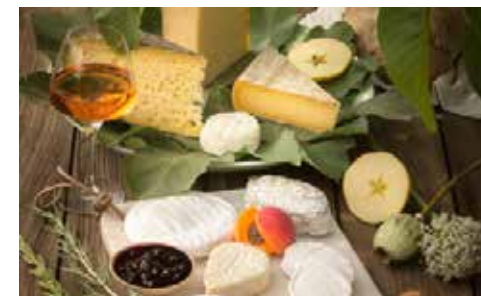
Fromages corréziens