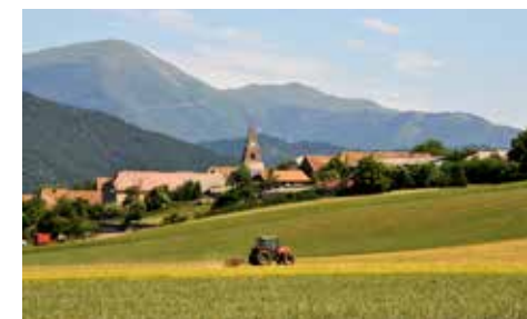
Paysages agricoles