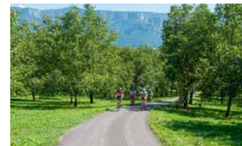
Balade à vélo au milieu des noyers

Château du Mollard - Christine Serve, 1 Rue du Mollard 38160 Saint-Marcellin 04 76 38 21 17 Horaires d'ouverture au public : le midi du mardi au dimanche, le soir vendredi et samedi Distance : sur le parcours