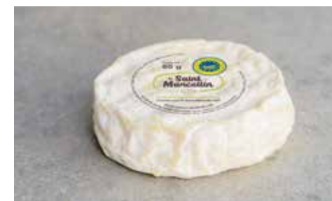
Saint-Marcellin IGP