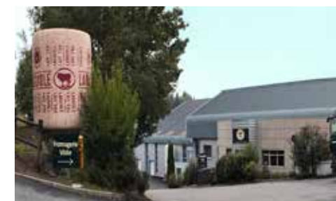
Jeune Montagne Fromagerie Laguiole

La Borie de Mondou 12210 Laguiole 06 88 96 02 46 Fromages : Laguiole fermier bio et tome fraîche Horaires d'ouverture au public : vente directe à la ferme Distance : 1,8 km