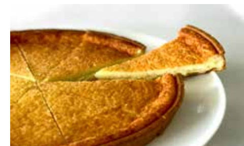
La Tarte à l'Encalat