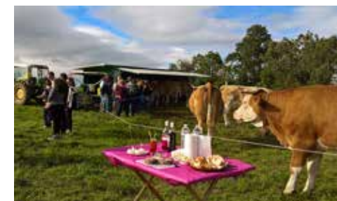
Visite à la ferme, goûter gourmand