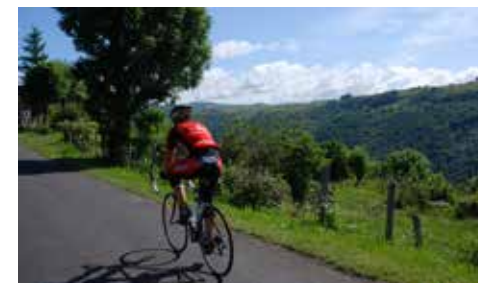
Cyclo-club Calardez

Ucafol 12210 Laguiole 06 03 22 16 86 Horaires d'ouverture au public : visite et goûter à la ferme Distance : 300 m