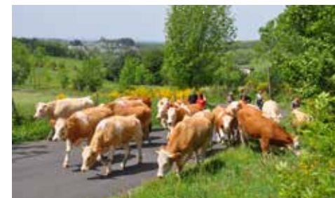
Transhumance des vaches laitières AOP Laguiole