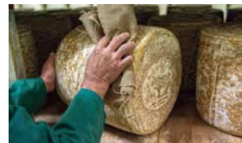
Affinage de fromage Laguiole, Jeune Montagne